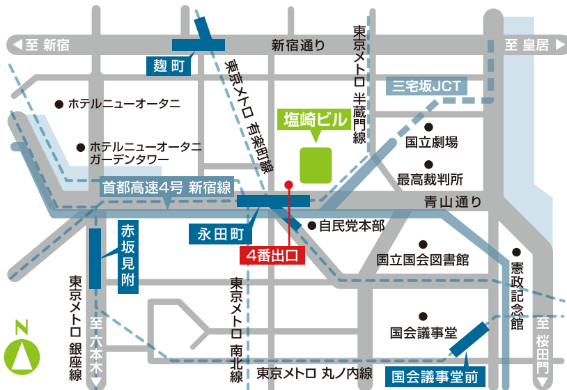
地下鉄5路線が乗り入れする東京メトロ「永田町」駅4番出口目前

「効果を実証しながら、自然にやさしい快適空間を提供／株式会社塩崎ビル」が、詳しく紹介されています。 東京商工会議所ホームページ http://eco-hint.tokyo-cci.or.jp/280